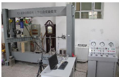
YJ- II D 型结构力学组合试验装置及组合配件