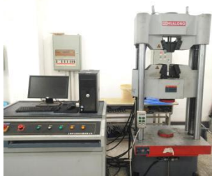
100 吨电液伺服万能试验机