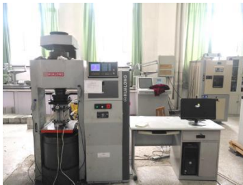
300 吨全自动压力试验机

工程力学实验室包括力学压力机房、材料力学室和结构力学室，有 30 吨、60 吨和 100 吨微机控制电液伺服万能试验机，300 吨全自动压力试验机、30 吨水泥压折机、YDD- I 型多功能材料力学试验机和 YJ- II D 型结构力学组合试验装置。承担着本科土木工程材料试验、混凝土结构试验、钢结构试验中关于材料力学性能测试这部分的试验，如：混凝土立方体试块的抗压强度试验、钢筋的拉伸试验、钢梁用钢材力学性能测定，水泥胶砂抗压抗折强度、建筑砂浆抗压强度等试验。此外，也承担着相当一部分教师及研究生课题试验中关于材料力学性能的测试工作。