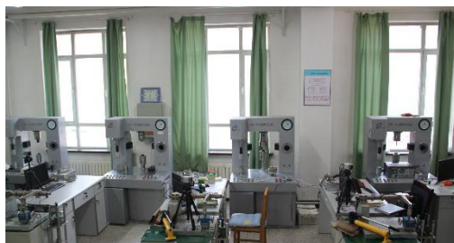
YDD- I 型多功能材料力学试验机