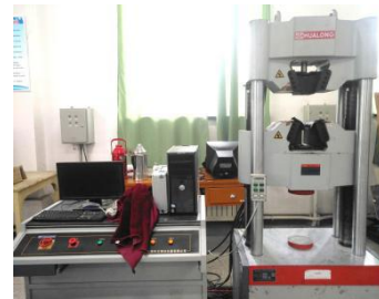
100 吨电液伺服万能试验机