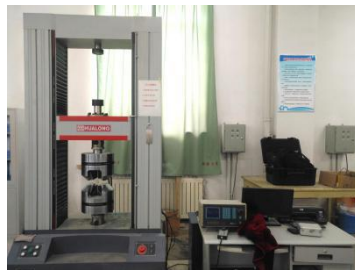
30 吨电液伺服万能试验机