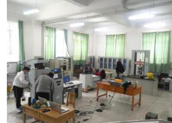
力学压力机房全景